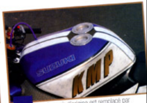
Le réservoir d'origine est remplacé par ce modèle aluminium de 24 litres, équipé de deux vannes Zenith.