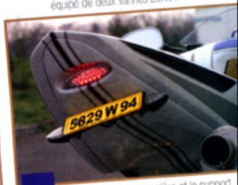
Les mini-clignotants arrière et le support de plaque proviennent de chez Motrax.