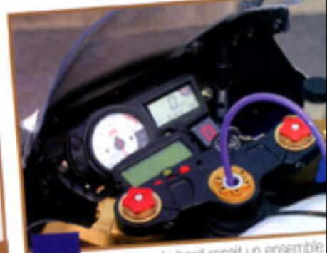
Le tableau de bord reçoit un ensemble Alphano Fun et un système Data Tool pour l'affichage des vitesses. Les T de fourche et les guidons sont signés Gilles Tooling.